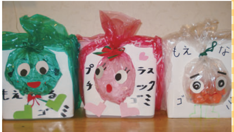
オリジナルごみ箱で楽しみながらゴミの分別をしています!

私達は2年前から活動をはじめた家族クラブです。エコクラブの存在をはじめて知ったのは4年前に開かれた「こどもエコクラブ全国フェスティバルinかめやま」です。その後おもしろそうだと興味を持ち入会しました。はじめはエコロジーというよりはエコノミーの精神ではじめたエコです。家庭の中で当たり前のように使われている電気やガスなどが全て地球からの恵みであることを認識し感謝しながら日々生活していくことを目標としています。