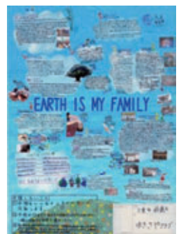
ゆきさやクラブは、こどもエコクラブ全国フェスティバルに三重県代表として参加します。

地球からの恵みを当たり前のもので使うのではなく、心から感謝し、大切に使うべきことをたくさんの子供達に知って欲しいと思います。できるなら、子ども達も、そして大人も地球に対してもっと謙虚な心で関わるべきなのではないかと思ひます。