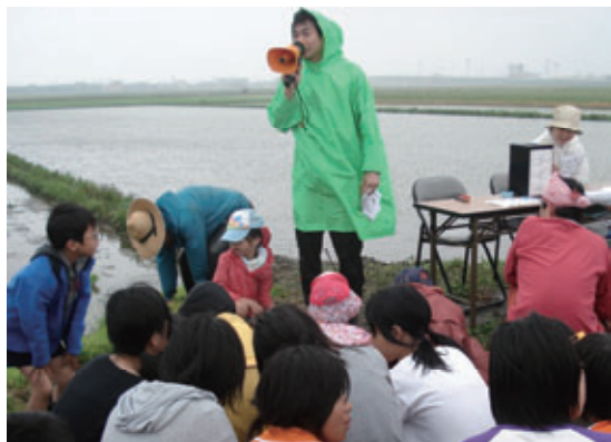
田植え体験を通じて、農業の面白さや大変さを実感できました。