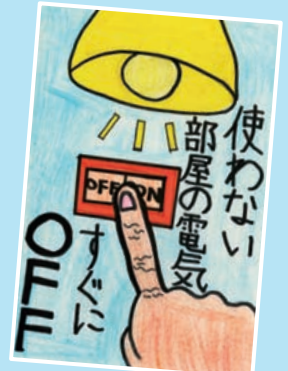
25年度 小・中学生の部 最優秀賞

詳しくは http://www.eco-mie.com/kouza/26/kankyo_etegami/index.html