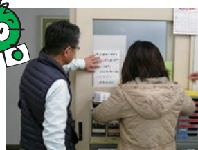
温度設定の啓発活動