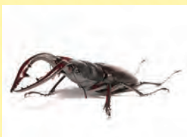
ノコギリクワガタ

アベマキを中心とした落葉樹の林と、シイを中心とした常緑樹の林が広がるミュージアムフィールド。里山を代表するような種類の林が残っています。どんな昆虫がいるのかな?