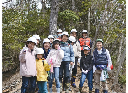
お客様体験イベントでの散策の様子

これまでの活動により、「ブレンディ®の森」鈴鹿内をぐるりと周遊できる山道が完成し、間伐エリアが拡張しました。山道脇にあるヒノキ、スギ、ヤマザクラなど、10種の樹木にQRコード付き樹名板を取り付け、憩いのベンチを設置するなど、お客様を招待できる森へと変化してきています。平成29年には、取引先と共同で一般のお客様を招待し、自然散策と丸太切りが体験できるイベントを開催しました。平成30年は、新たに活動エリアを拡大し、水辺周辺エリアの整備に取り掛かり、より水を育む環境づくりをめざしていきます。