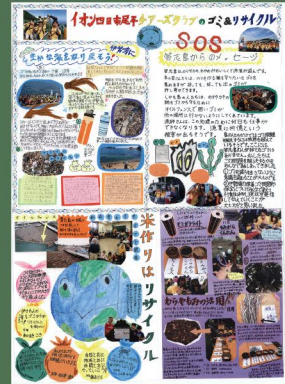
▲三重県の壁新聞応募作品は、センター展示ホールに展示をしています。

☆こどもエコクラブとは、幼児(3歳)から高校生までなら誰でも結成・参加できる環境活動のクラブです。