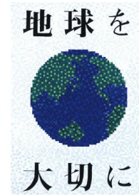
平成30年度 中学生の部 最優秀賞