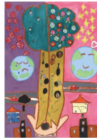
平成30年度 小学生の部 最優秀賞