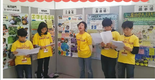
▲「ごみ・リサイクル」をテーマにした活動や、毎年続けている海岸清掃活動や問題になっているマイクロプラスチックについても発表しました。

「こどもエコクラブ全国フェスティバル」には、全国のクラブから応募された壁新聞をもとに、全国事務所の審査により選ばれた都道府県代表が参加できます。