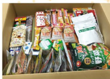
春のキッズエコフェア分

いただきものの詰め合わせを消費できない…、自分の口に合わないけれど、もったいなくて捨てられない…、そんな家庭にあるけれど消費しない食品をお持ちください。お持ちいただいた方はゼロ吉エコバッグを差し上げます。