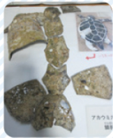
▲鱗板(うろこがくっついたもの)