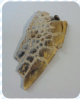
▲アカウミガメの前足