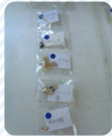
▲おなかのなかにあったもの