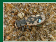
「白塚の浜を愛する会」HPより

こんなかわいい鳥や虫がいる砂浜にマイクロプラスチックのごみがいっぱい砂に隠れて落ちているなんて信じられないゾウ!