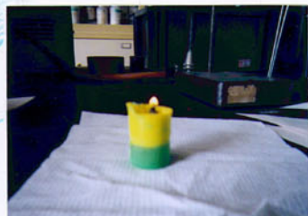
クレヨンを溶かしている所。この時、ちょっとにおいます...