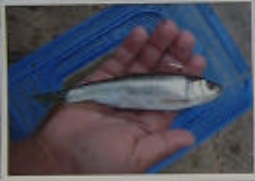
感想 ぼくたちは 鈴鹿川に行 くと魚を見 て水がきれい なところを 調べようとして きました。

すきとおった体に黒いす じのもようがあるエビの仲 間でながれのゆるやかな川や 水のきれいな池などでみ つかります。きれいなエビで、 水中の草の中にひそんでいます。 体長は5~6cmです。