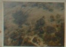
この写真はD地点あたりの写真でD地点と見た理由は水の濁りです。