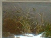
この写真はE地点あたりの写真でE地点と見た理由は水の濁りです。