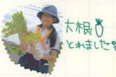
大根をとりました