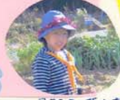
コスモスの花か、作り