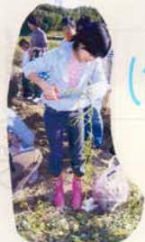
さつまいものくぼきを集めています