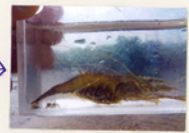
テナガエビ 卵もみいす