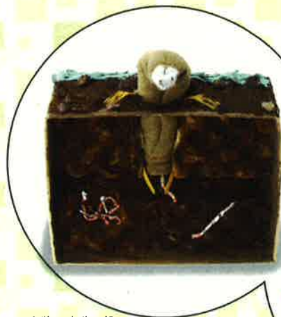
小学1・2年生の部 「もぐらづか」