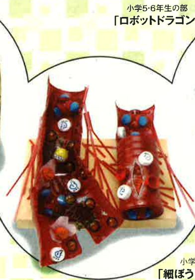
小学5・6年生の部 「ロボットドラゴン」