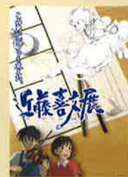
「百をすませば」絵コンテ(部分)