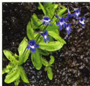
イタカムシトリスミレ(食虫植物)