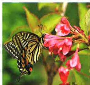
タノウツギの花を訪れたアゲハ