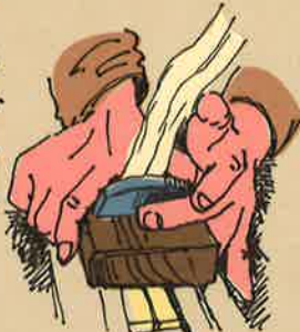
＜若宮・若宮の匠さん＞

のびは木を削って木を削り、おぼののびを削り、響かせる。おぼののびを削り、響かせる。おぼののびを削り、響かせる。